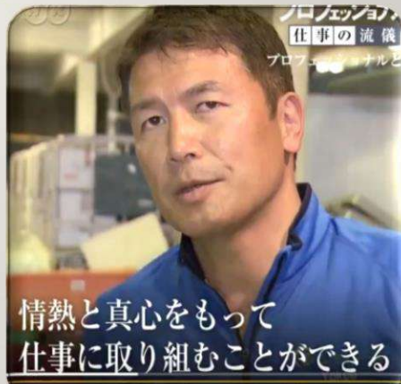
※NHKプロフェッショナル 遺品と心を整理する 出演