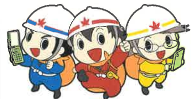
広島県防災キャラクター「タスケ三兄弟」